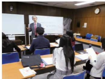
スキルアップ講座「英語論文セミナー」

今年度は英語論文執筆に必要な文法などの技法を学ぶ英語論文セミナーと、国際学会での質疑応答やポスター発表での会話のコツ、学会でのネットワーク作りに役立つ会話表現を学ぶ、学術英会話セミナーを開催しました。