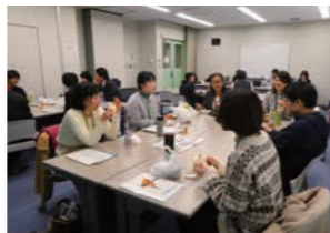
第1回 国立研究開発法人産業技術総合研究所

第1回 国立研究開発法人産業技術総合研究所 第2回 国立研究開発法人農業・食品産業技術総合研究機構 日 時:平成31年2月14日(木) 10:00~15:00 日 時:平成31年2月28日(木) 13:20~15:30 参加者:14名 参加者:26名