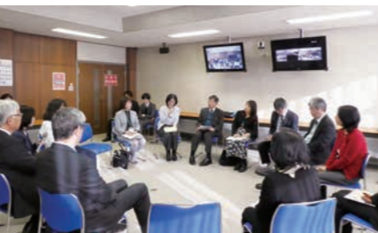
ダイバーシティをテーマにした意見交換会

日 時:平成31年2月21日(木) 15:00~16:00 会 場:水戸キャンパス 事務局棟第二会議室 [VCS接続会場]工学部応接室(日立)・農学部第1会議室(阿見) 参加者:24名